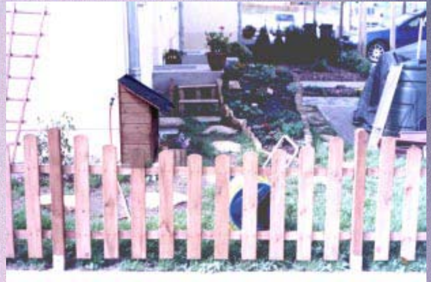
Des appendices décoratifs reproduisent la structure d'ensemble.

...que peut-il y avoir d'autre que des signes de vie, une épingle qui tombe, une feuille qui remue, ou le petit cri que jettent les grenouilles quand la faux les coupe en deux, ou qu'on les attrape, dans l'eau, à la lance, on pourrait multiplier les exemples, ce serait même une excellente idée, mais voilà, on ne peut pas.