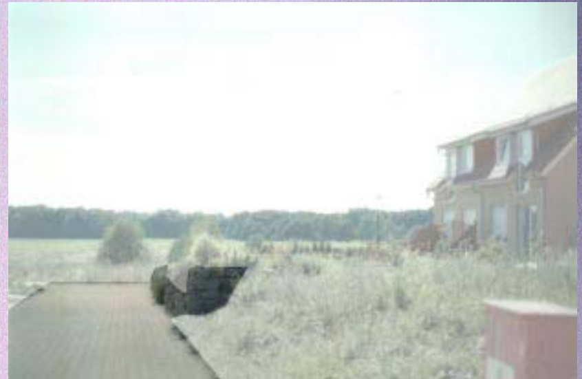
Un mur inachevé borde la rue qui mène aux champs.

L'espace est le lieu et la révélation à la fois. (Olivier Debré)