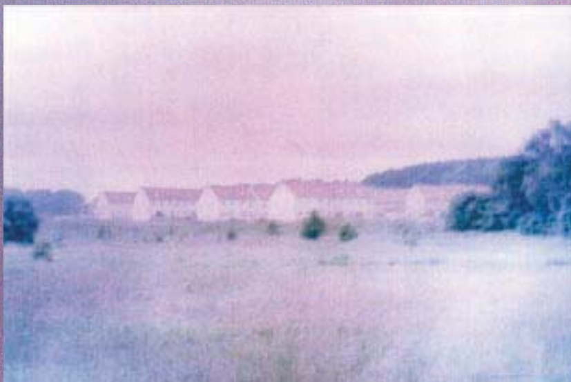
Première rencontre, première impression.