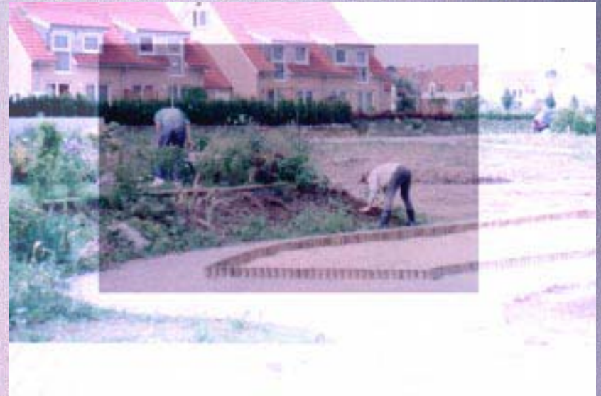
Les travaux et les jours (ou : L'angélus à Weixdorf).

... je suis prêt à être tout ce qu'ils veulent, je suis las d'être matière, matière, tripotée sans cesse en vain. (Beckett, L'innommable)