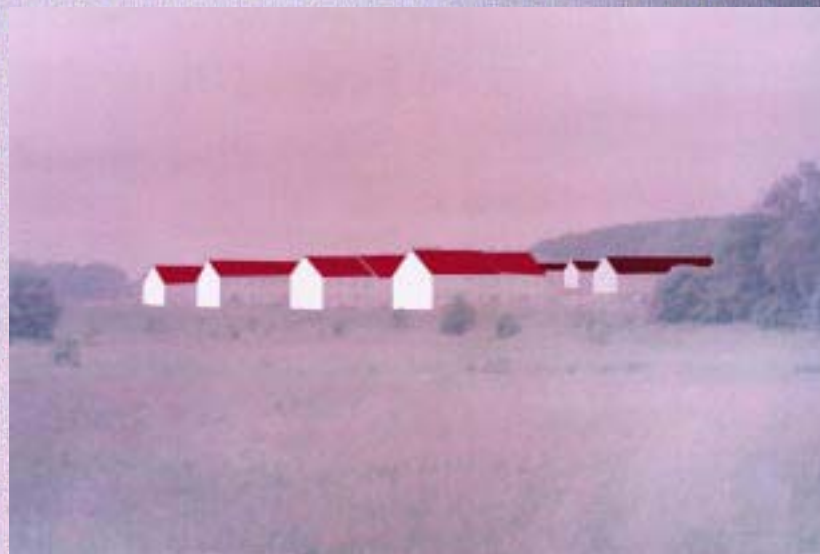
Alignement de grosses maisons. Et pas de structure fragmentaire comme je le croyais.

Attaques sur le chemin le soir, dans la neige. (Kafka)